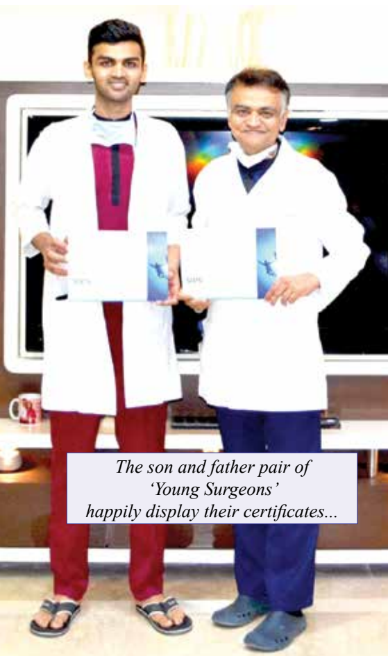
The son and father pair of 'Young Surgeons' happily display their certificates...