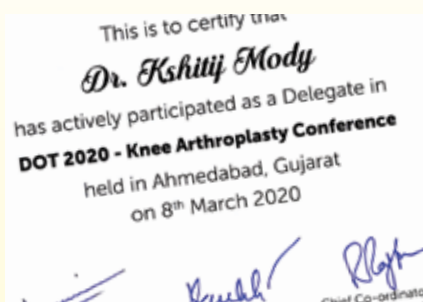
Academic Contributions: Page 2