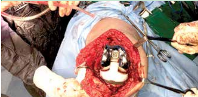
ઘણી કુશળ મહેનત પછી નવો સાંધો બેસાડ્યો