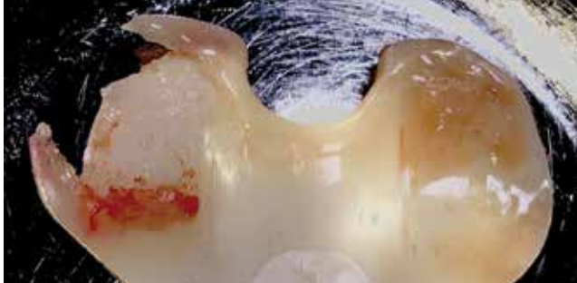
તેના અંદરનો પ્લાસ્ટીકનો હિસ્સો તૂટી ગયો હતો