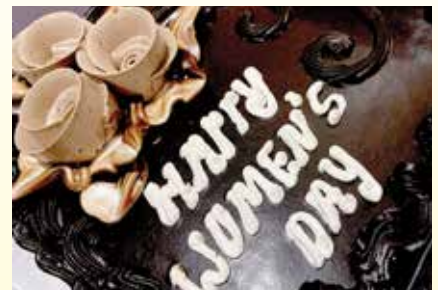
Women's Day celebrations... Page 8