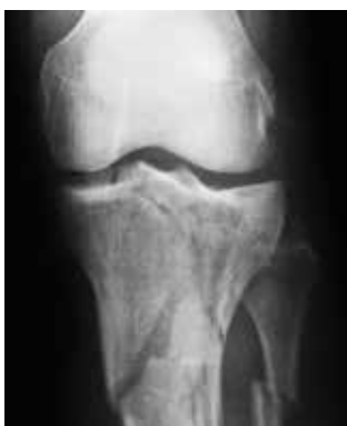
This is how the complex fracture looked before surgery.

'The blessings of modern fracture surgery are indeed magical!', says Dr Kshitij Mody