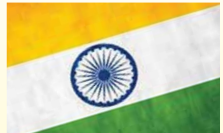
૨૬ જાન્યુઆરીની અનોખી ઉજવણી... પાનું ૮