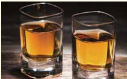
The Glass that Kills... page 2