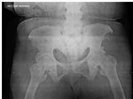
Left: X-Ray before the hip replacement, Right: X-Ray after the hip replacement.