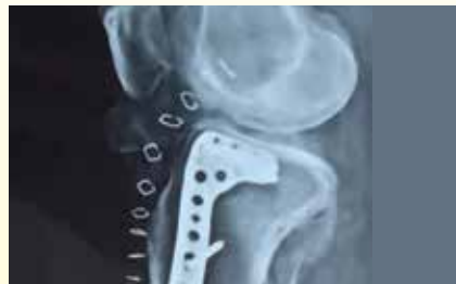
Fast treatment of fractures... page 7