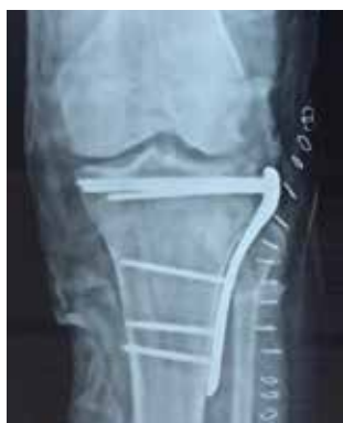
The end result of skilled surgery with plates & screws.