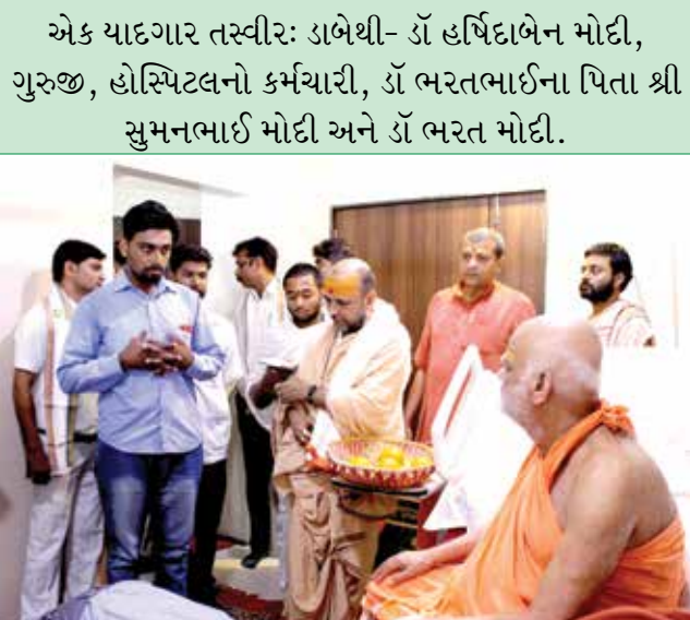
વિદાઈ સમયે દર્શને આવેલા ભક્તો....