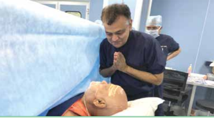
ઓપરેશન બાદ આશીર્વાદ પ્રાપ્ત કરતા ડો. મોદી