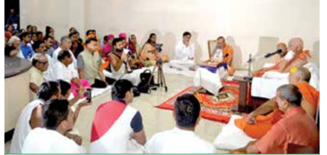
શંકરાચાર્યજીના પ્રવચન નો લાભ લઈ રહેલી વેલકેર ટિમ