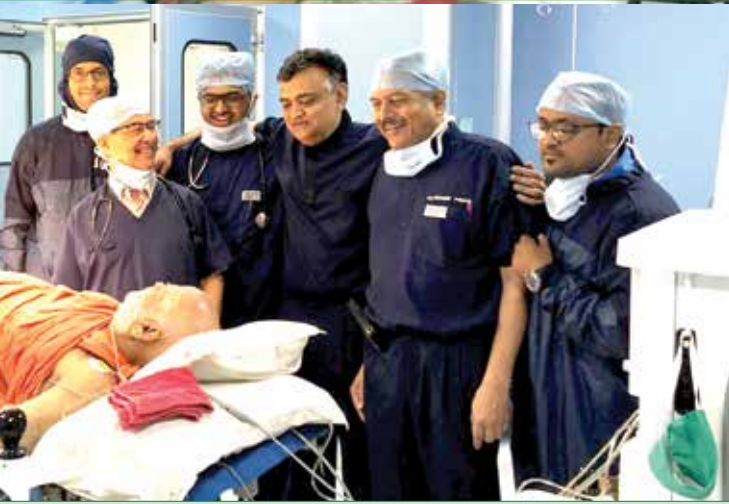
સફળ ઓપરેશન પછી ઓપરેશન થિએટરમાં શંકરાચાર્યજી સાથે વેલકેર ટિમ