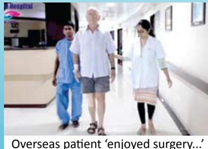
Overseas patient 'enjoyed surgery...'