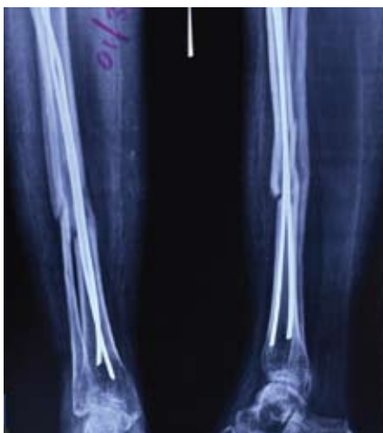
Fractures in tibia [leg bone]

Welcare Hospital uses PRP [platelet rich plasma] to cure non healing fractures routinely