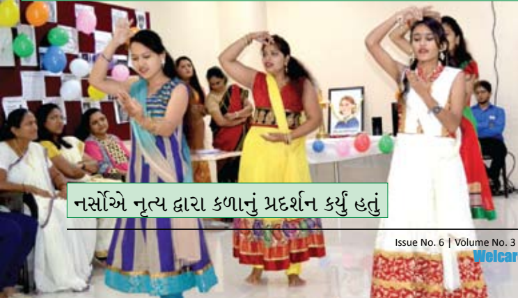
નર્સોએ નૃત્ય દ્વારા કળાનું પ્રદર્શન કર્યું હતું