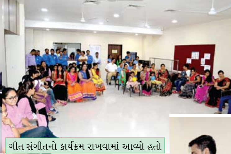
ગીત સંગીતનો કાર્યક્રમ રાખવામાં આવ્યો હતો