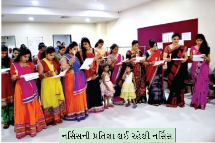
નર્સિસની પ્રતિજ્ઞા લઈ રહેલી નર્સિસ