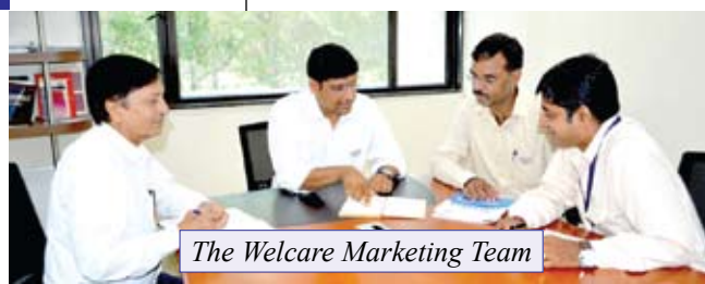
The Welcare Marketing Team

Many times this involves travelling long distances, living in remote places and interacting with people far different from urban society. But, says the marketing team, the gratitude of the beneficiaries of such camps is reward enough.