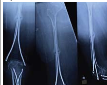
Fractures in femur [thigh bone]