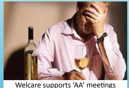
Welcare supports 'AA' meetings