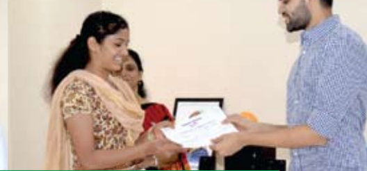
ઉત્કૃષ્ટ કામ માટે સન્માન પત્ર મેળવનાર કર્મચારી. દર વર્ષે સારૂ કામ કરનાર સ્ટાફને એવા સન્માન પત્ર આપવામાં આવે છે.