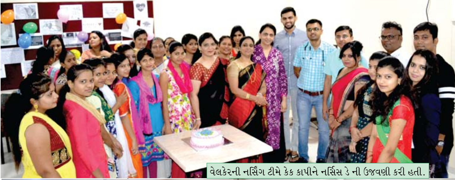
વેલકેરની નર્સિંગ ટીમે કેક કાપીને નર્સિસ ડે ની ઉજવણી કરી હતી.

...અને સાથે ગીત સંગીત દ્વારા પોતાની કળાનું પ્રદર્શન કરતી વેલકેર હોસ્પિટલની નર્સિસ. કિતાબ પ્રદાન સમારોહ