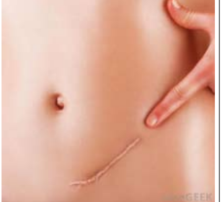
જુના સમયમાં ઉપર બતાવ્યામુજબ લાંબા કાપા કરી વાઢકાપ કરવામાં આવતી હતી. કાપો (ઇન્સિજન) જેટલો લાંબો તેટલું સર્જનને પેટના અંદરના અવયવ વધું સારા દેખાય અને સર્જરી કરતા સર્જનને અનુકુળ રહે. પરંતુ તેમાં તકલીફ એવી થતી હતી કે ઘા મોટો થતો, રૂઝ આવતા વાર લાગતી અને લાંબા સમય સુધી હોસ્પિટલમાં દાખલ