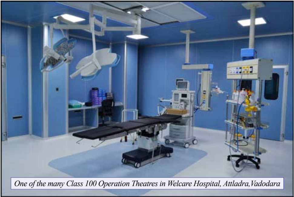
One of the many Class 100 Operation Theatres in Welcare Hospital, Attladra, Vadodara

dust particle measures about 0.5 mm across, it is logically possible that about 50,000 bacteria each measuring about 5 microns