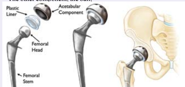
Components of the Artificial Hip Joint used for replacement

is now days made from specialised ceramic and are incredibly smooth and wear resistant. The smoothness reduces friction and wear and makes the joint last for least 20-30 years as compared to the 10-15 years life span of the joint parts. 20-30 years are sufficient to last for a patient's lifetime. Welcare Hospital uses these advances in technology for Total Hip Replacements.