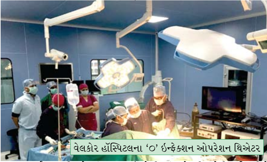
વેલકેર હોસ્પિટલના 'O' ઈન્ફેક્શન ઓપરેશન થિએટર