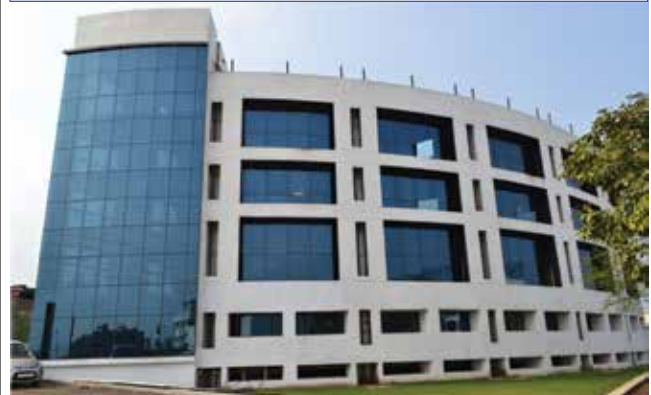
All sides of Welcare's building are designed with an aim to harvest as much natural day light as possible, while at the same time keeping out direct sun light to prevent heating.