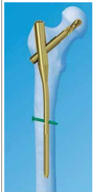
Proximal Femoral Nail [PFN] is the latest design in nails with a curve that perfectly fits in the femur.

Welcare Hospital uses the most advanced generation of nails that have been specifically tailor-made for the Asian population, thereby reducing the chances of failure to an absolute minimum and resulting in perfect recovery.