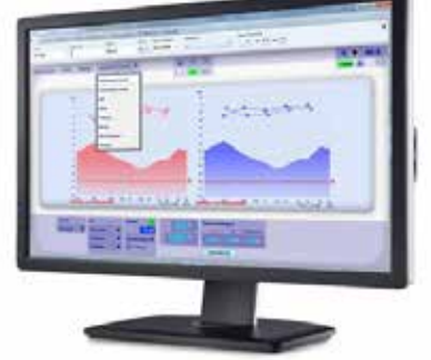
ઓડિયોમેટ્રી : બહેરાશ માટે સરળ અને સાદી તપાસ

કાનમાં ઈમ્પ્લાન્ટ મુકવાની સર્જરી ખૂબજ ગુંચવણ ભરી હોય છે, કે