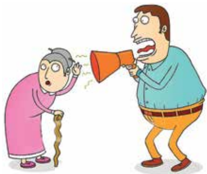
હે..... શું કીધું ?????? જુઓ પાનું ૭