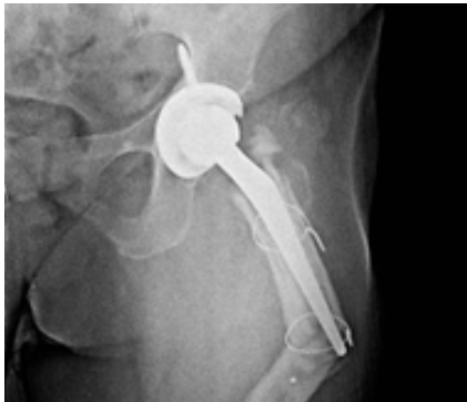
Treating Complex Fractures.....P 5