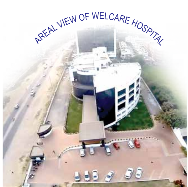
With wide passages, staircases and plenty of space in and around its premises, Welcare Hospital provides a safe environment for patient care.

Other areas where Welcare Hospital has started delivering high quality treatment in