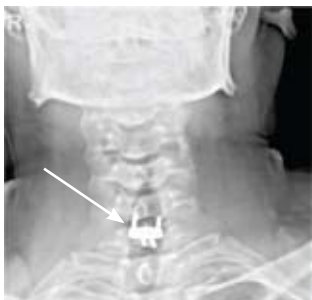
Artificial disc placed between the 6th & 7th vertebrae