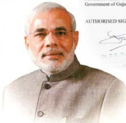
NARENDRA MODI Chief Minister, Gujarat

It is noteworthy that the motivation of the then Prime Minister Hon. Shri Narendra Modi not only inspired giant business groups to invest in Gujarat but also Small to Medium entrepreneurs like Dr Bharat Mody. That inspiration from the Nation's leader has created a state of the art landmark hospital in Vadodara and become the pride of Gujarat.