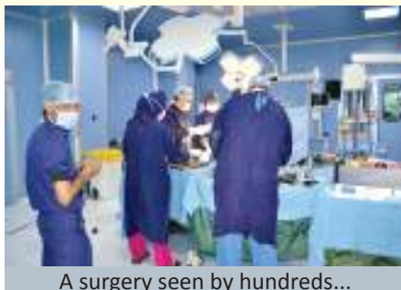
A surgery seen by hundreds...