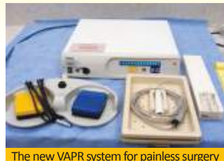
The new VAPR system for painless surgery