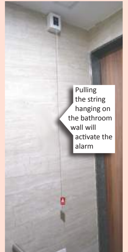
Pulling the string hanging on the bathroom wall will activate the alarm

A special safety feature to immediately help patients who fall in the toilet is a FIRST in Welcare. If a patient should slip and fall during ablutions, he/she may pull a string and a high alert alarm will bring not only a nurse but also a maintenance officer to open the door if necessary and rescue the patient. An SMS also goes to the Operations Manager and CEO of Welcare after such a fall.