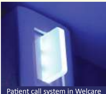
Patient call system in Welcare

Issue No. 5 | Volume No. 2 | Published on 1 July 2017