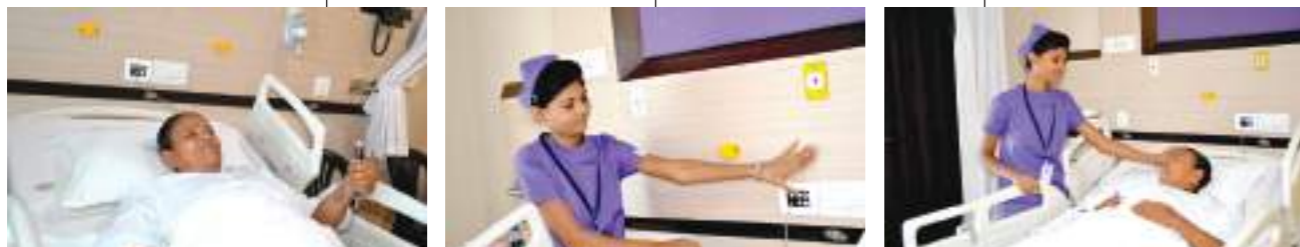
A patient in distress calls, a nurse attends the call in minutes and cancels the ringing, soothes the patient and helps...

The patient used to have epileptic fits when he was a child, the fits had stopped for many years. This important fact was not told to the doctor who wrote the history of the patient hence there was no mention of the possibility of convulsions. For some reason the fits recurred two days after his surgery. A neurophysician was consulted for the disease.